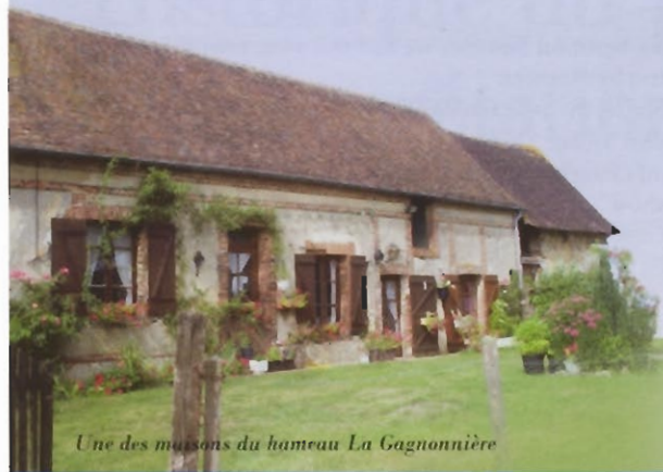
Une des maisons du hameau La Gagnonnière